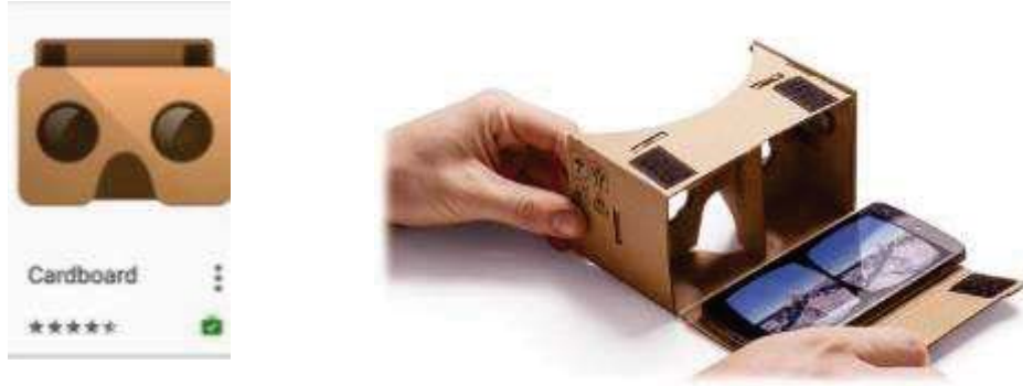
Şekil 3. Cardboard Gözlük

Sanal gerçeklik uygulamaları maliyetli bir teknoloji olarak gözüke de son zamanlarda sanal gerçeklik deneyimi herkes tarafından istenilir ve aranır hale gelmiştir. Sanal gerçekliğe olan ilginin artması başta mobil teknoloji firmalarının ilgisini çekmiş ve sanal gerçeklik bileşenlerini içeren çok sayıda yeni mobil donanımın ve uygulamanın geliştirilmesinin önü açılmıştır. Özellikle sanal gerçeklik gözlüklerinin maliyetleri düşürülerek mobil işletim sistemleri için sanal gerçeklik uygulamaları ulaşılabilir ve kullanılabilir hale gelmiştir. PlayStore veya App Store'dan indirilebilen birçok ücretsiz sanal gerçeklik uygulaması, Google firması tarafından geliştirilen ucuz maliyetli Cardboard gözlükleri sayesinde (Şekil 3) akıllı cihazlara sahip her kullanıcının kolaylıkla ulaşabileceği hale gelmiştir.