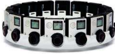
Şekil 5. Jump Kamera Düzeneği

Sanal gerçeklikteki diğer bir yeni teknoloji Jump kamera düzeneği ile oluşturulmuş sanal gerçeklik videolarıdır. Bu teknoloji kullanıcılara 360 derece video izleme imkânı sunmaktadır. Jump kamera düzeneği, dairesel bir düzende yerleştirilmiş 16 kamera modülünden oluşmaktadır (Şekil 5). Bu düzeneğin boyutu ve kameraların yerleşimi Jump derleyici programıyla birlikte çalışacak şekilde optimize edilmiştir. Jump derleyici programı 16 parçadan oluşan video görüntüsünü stereoskopik sanal gerçeklik videosuna dönüştürmektedir. Yüksek çözünürlükteki stereoskopik görüş teknolojisi sayesinde yakındaki nesnelere yakında, uzaktaki nesnelere ise uzakta görünmektedir. Bu cihazlarda kesintisiz ve panoramik bir görüntü elde edebilmek amacıyla özel olarak geliştirilen ve sisteme entegre edilmiş olan 3D hizalama yöntemi kullanılmaktadır. Böylece her bir kameradan ayrı ayrı gelen kamera görüntülerinin birleştirildiği yerler fark edilmemektedir. Derlenen 3D videolar, en az beş adet 4K görüntüye eşdeğer süper yüksek çözünürlükte görüntülerdir. Bu teknolojinin sinema ve oyun sektöründe yeni bir akımı ortaya çıkaracağı öngörülmektedir.