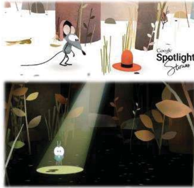
Şekil 6. Google Spotlight Stories