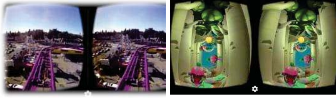
Şekil 4. Cardboard Gözlükler ile Yaşanabilecek Farklı Deneyimler

Sanal gerçeklikteki diğer bir yeni teknoloji Jump kamera düzeneği ile oluşturulmuş sanal gerçeklik videolarıdır. Bu teknoloji kullanıcılara 360 derece video izleme imkânı sunmaktadır. Jump kamera düzeneği, dairesel bir düzende yerleştirilmiş 16 kamera modülünden oluşmaktadır (Şekil 5). Bu düzeneğin boyutu ve kameraların yerleşimi Jump derleyici programıyla birlikte çalışacak şekilde optimize edilmiştir. Jump derleyici programı 16 parçadan oluşan video görüntüsünü stereoskopik sanal gerçeklik videosuna dönüştürmektedir. Yüksek çözünürlükteki stereoskopik görüş teknolojisi sayesinde yakındaki nesnelere yakında, uzaktaki nesnelere ise uzakta görünmektedir. Bu cihazlarda kesintisiz ve panoramik bir görüntü elde edebilmek amacıyla özel olarak geliştirilen ve sisteme entegre edilmiş olan 3D hizalama yöntemi kullanılmaktadır. Böylece her bir kameradan ayrı ayrı gelen kamera görüntülerinin birleştirildiği yerler fark edilmemektedir. Derlenen 3D videolar, en az beş adet 4K görüntüye eşdeğer süper yüksek çözünürlükte görüntülerdir. Bu teknolojinin sinema ve oyun sektöründe yeni bir akımı ortaya çıkaracağı öngörülmektedir.