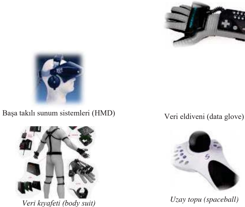
Şekil 2. Sanal Gerçeklikte Kullanılan Etkileşim Cihazları

Sanal gerçeklikte kullanılan etkileşim cihazları amaçlarına göre farklılık gösterebilmekte olup aşağıda bu etkileşim cihazları tanıtmaya çalışılmıştır: Şekil 2’de sanal gerçeklikte kullanılan etkileşim cihazları gösterilmiştir: